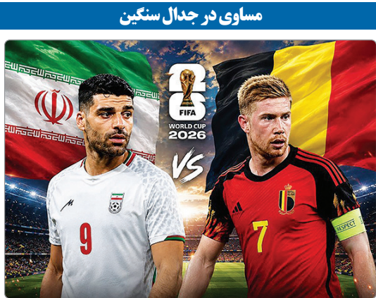
«جهان صنعت» - تیم ملی ایران مقابل بلژیک به یک امتیاز ارزشمند رسید.

تیم ملی ایران از ساعت ۲۲:۳۰ (یکشنبه شب) در ورزشگاه سوفاوی لس آنجلس به مصاف بلژیک رفت و در پایان به نتیجه تساوی صفر - صفر رسید.