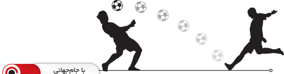
با جام جهانی