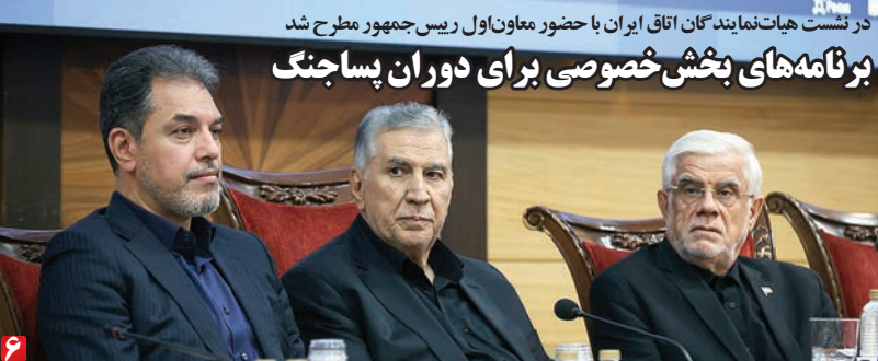
در نشست هیات‌نماینده گان اتاق ایران با حضور معاون اول رییس جمهور مطرح شد برنامه‌های بخش خصوصی برای دوران پسا جنگ

علاوه بر این تصرف مناطق یادشده می‌تواند باعث توسعه جغرافیایی اسرائیل هم باشد که اگرچه در کوتاهمدت ممکن است مخالفت‌هایی را در بر داشته باشد ولی به‌تدریج سرزمین‌های تصرف شده به صورت دوفاکتو به خاک اسرائیل ضمیمه و الحاق می‌شود. با این اوضاع آیا شناسی برای توافق میان ایالات متحده و جمهوری اسلامی ایران وجود دارد و آیا تفاهم فعلی پایدار خواهد بود؟ دست‌کم روی کاغذ واشنگتن ناچار به حفاظت از تفاهم مذکور و تبدیل آن به توافق است. هم اسرائیل و هم ایالات متحده می‌دانند که با شرایط و تسونامی فعلی، امکان نابود کردن جمهوری اسلامی در ایران را ندارند و تکرار حملات و حتی انجام حملات پر دامنه و خشن‌تر، فقط اوضاع را