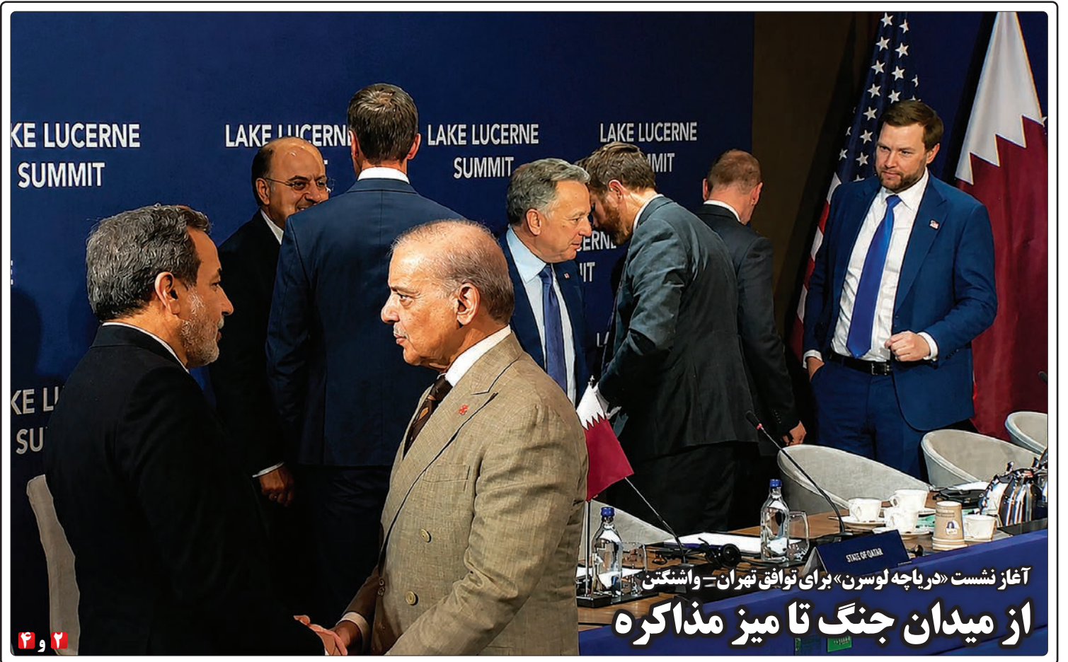
آغاز نشست «دریاچه لوسرن» برای توافق تهران - واشنگتن از میدان جنگ تا میز مذاکره