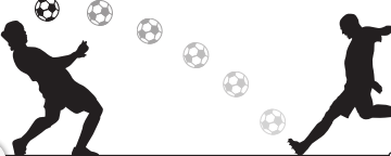
با جام جهانی