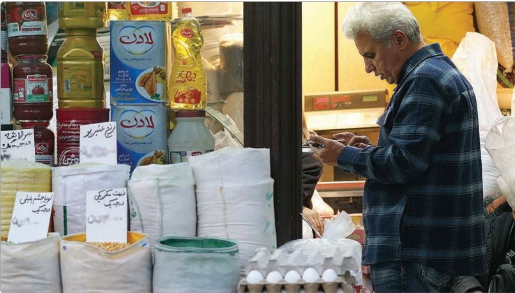
رئیس‌جمهور، «سید علی خامنه‌ای» در حال خرید از فروشگاه.

اساسی‌ترین نیازهای یک زندگی استاندارد» است که مستقیماً تحت کنترل دولتها قرار دارد. وقتی دولتها به جای ناظر، خود بازیگر اصلی می‌شوند، انحصار خلق می‌شود و انحصار، گران‌فروشی ساختاری را به همراه می‌آورد.