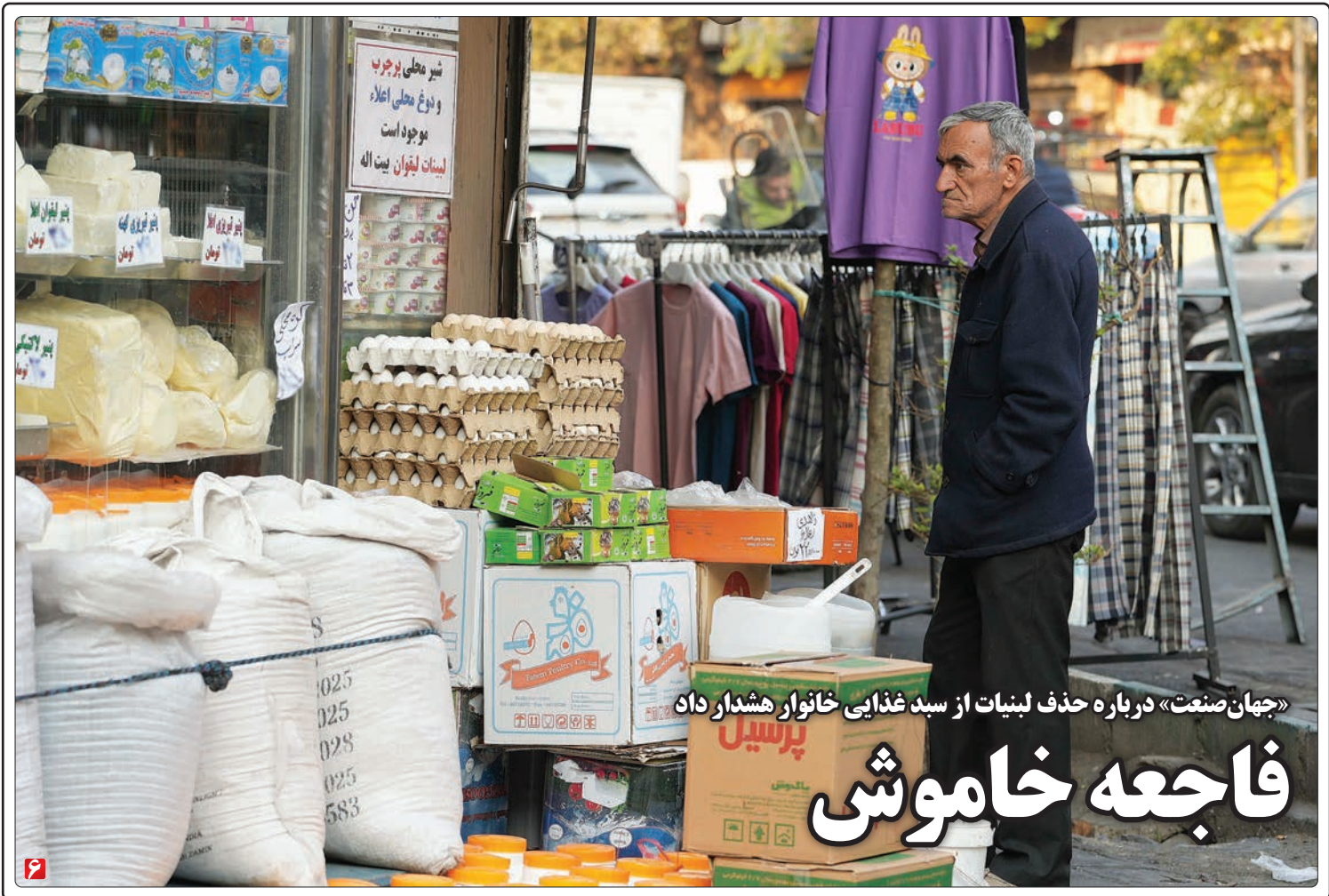
«جهان صنعت» درباره حذف لبنیات از سبد غذایی خانوار هشدار داد