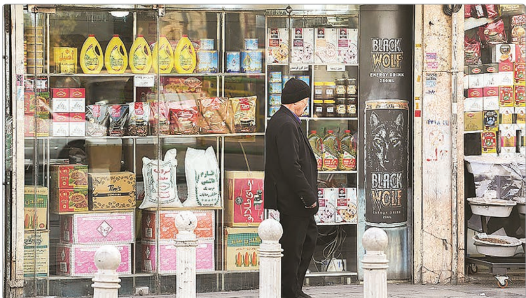
رابع - جهان صنعت

معلوم نیست چه سرنوشتی داشته باشد توجهی دارد یا خیر. در غیاب امید به آینده میل به پیشرفت و توسعه نیز در جامعه به حداقل می‌رسد. پیامد نگران‌کننده دیگر تغییر ماهیت روابط انسانی است. در شرایط تعلیق طولانی مدت توانایی افراد برای مدیریت عقلانی تنش‌ها کاهش می‌یابد و روابط اجتماعی به سمت هیجانات منفی سوق پیدا می‌کند. افزایش خشم، پرخاشگری و رفتارهای تکانه‌ای در سطح جامعه و خانواده‌ها نشانگر این تغییر رویکرد است. در این شرایط فشار روانی مضاعف افراد را به سوی «فرار» سوق می‌دهد؛ فراری که گاه از طریق پناهندن به مواد مخدر، الکل و روانگردان‌ها برای تسکین موقت رنج‌های روانی نمود پیدا می‌کند و گاه در قالب فروپاشی نهاد خانواده و افزایش آمار طلاق مشاهد می‌شود چرا که وقتی خانواده توان اقتصادی برنامه‌ریزی برای آینده را نداشته باشد هزینه‌های زندگی و تضادهای ناشی از بی‌ثباتی پیوندها را سست می‌کند. مثلت فقر، بزهکاری و آسیب اجتماعی سرفی‌زیدی ادامه داد: در لایحه دیگر شاهد خروج تدریجی سرمایه‌های انسانی و اقتصادی از کشور هستیم. نیروهای متخصص و نخبگان فکری وقتی با فضای آن ناپایدار و فقدان زیرساخت‌های لازم برای یک‌زندگی آرام مواجه می‌شوند مهاجرت را تنها راه نجات می‌بینند. این تهی‌شدن جامعه از درون نتایج فرار مغزها و سرمایه‌ها را در پی دارد بلکه ساختار توسعه‌ای کشور را در بلندمدت دچار فروپاشی نرم می‌کند. در نهایت باید به پیوند ناگسستنی بحران‌های