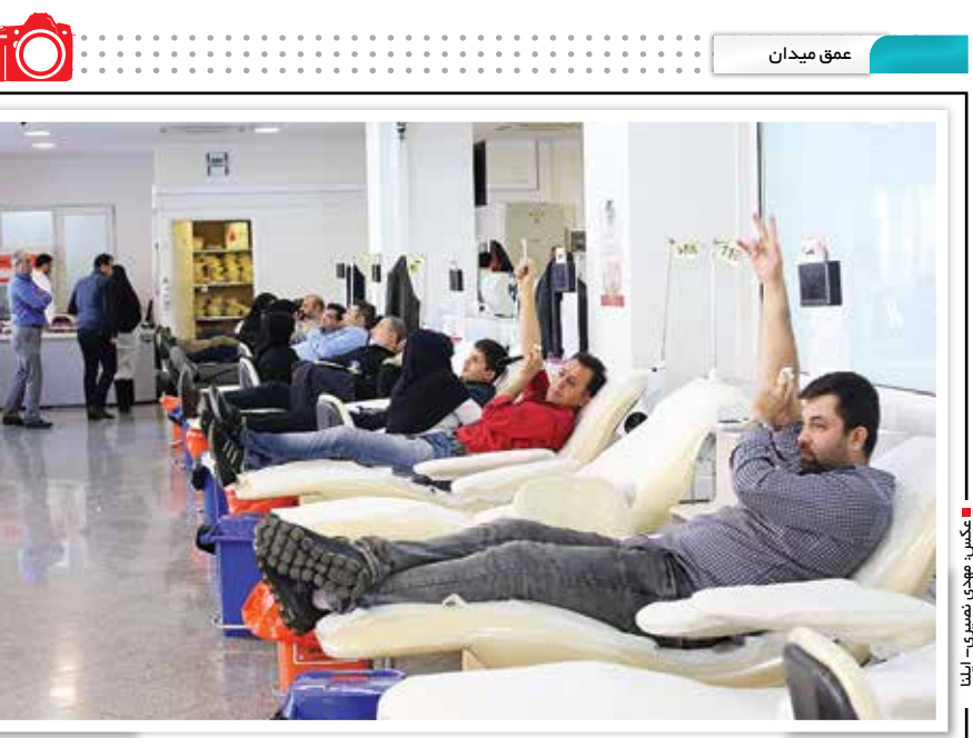
داوطلبان اهدای خون به زلزله‌زدگان