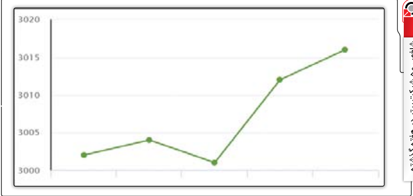
شاخص ۵ شرکت برتر در هفته گذشته

«وساخت» در دوره یک ماهه منتهی به ۳۰ دی ماه ۹۵ هیچ سهم بورسی را خرید و فروش نکرد. سرمایه‌گذاری ساختمان ایران صورت وضعیت پرتفوی سرمایه‌گذاری‌ها در دوره یک ماهه منتهی به ۳۰ دی ماه ۹۵ را حسابرسی نشده منتشر کرد. این شرکت سرمایه‌گذاری در ماه گذشته و با سرمایه یک هزار و ۹۰ میلیارد و ۲۹۶ میلیون ریال، تعدادی از سهام چند شرکت بورسی را با بهای تمام شده یک هزار و ۵۲۰ میلیارد و ۸۹۸ میلیون ریال و ارزش بازار سه هزار و ۸۳۳ میلیارد و ۹۱۸ میلیون ریال در سبد سهام خود داشت. بهای تمام شده سهام این شرکت طی دوره یادشده بدون تغییر بود. در حالی که ارزش بازار سهام بورسی این شرکت با کاهش ۱۹۱ میلیارد و ۹۲ میلیون ریالی در پایان دوره معادل سه هزار و ۶۹۴ میلیارد و ۸۳۶ میلیون ریال اعلام شد. «وساخت» طی یک ماه گذشته هیچ سهم بورسی را خرید و فروش نکرد.